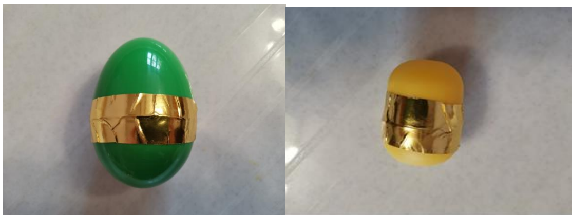
Маленький звучит тише.

А теперь послушаем, какие они издадут звуки. Можно потрясти ими, а можно постучать друг о дружку. Отгадай, какой орешек звучит, маленький или большой?